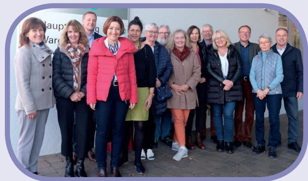
Vorstand 2023 und hauptamtliche Mitarbeiterinnen

Wir suchen laufend Personen, die sich ehrenamtlich engagieren und Betreuungen übernehmen können.